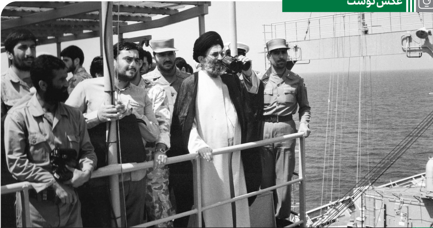
حضور آیت الله خامنه‌ای در مانور دریایی ذوالفقار (۱۳۶۷/۳/۳)